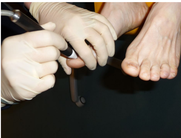
Meridianendpunkte an Händen und Füßen werden gemessen

Unsere Probandin hält ein Glas Wasser in der Hand und wird gemessen. Danach bekommt sie ein gleich aussehendes Glas Wasser in die Hand und wird wieder gemessen. Sie weiß natürlich nicht, welches das energetisierte Wasser ist. Das zweite Glas Wasser stand eine Viertel Stunde auf einem \overline{\text{HIFINE}} – Zylinder. Die positive Reaktion unserer Probandin ist eindeutig zu erkennen (siehe unten).