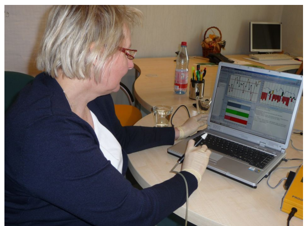
Anzeige der einzelnen Meridiane